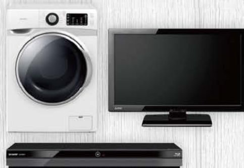
画像は、イメージです。お引渡しは竣工引き渡し後とさせていただきます。