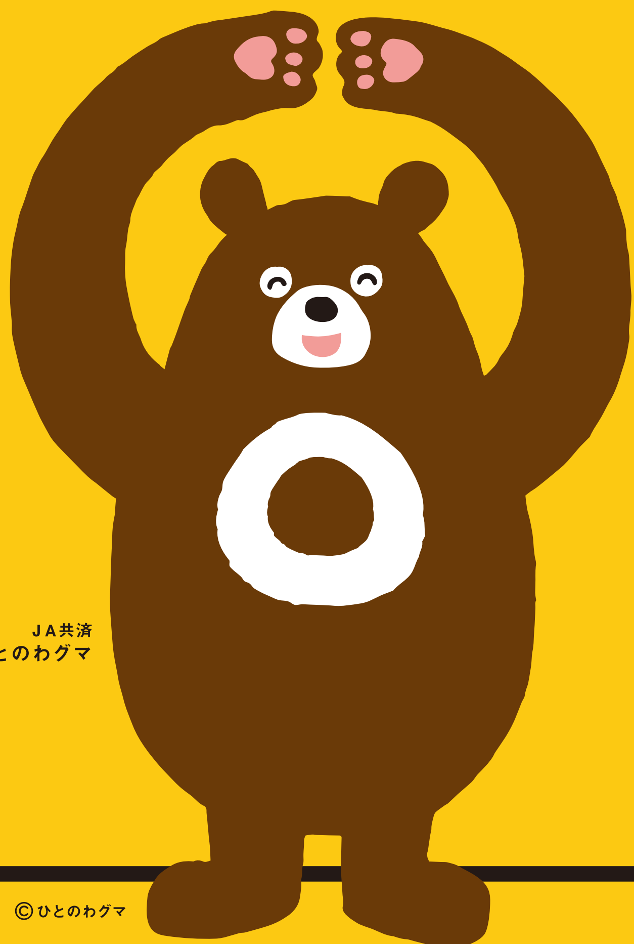
JA共済 ひとのわぐま