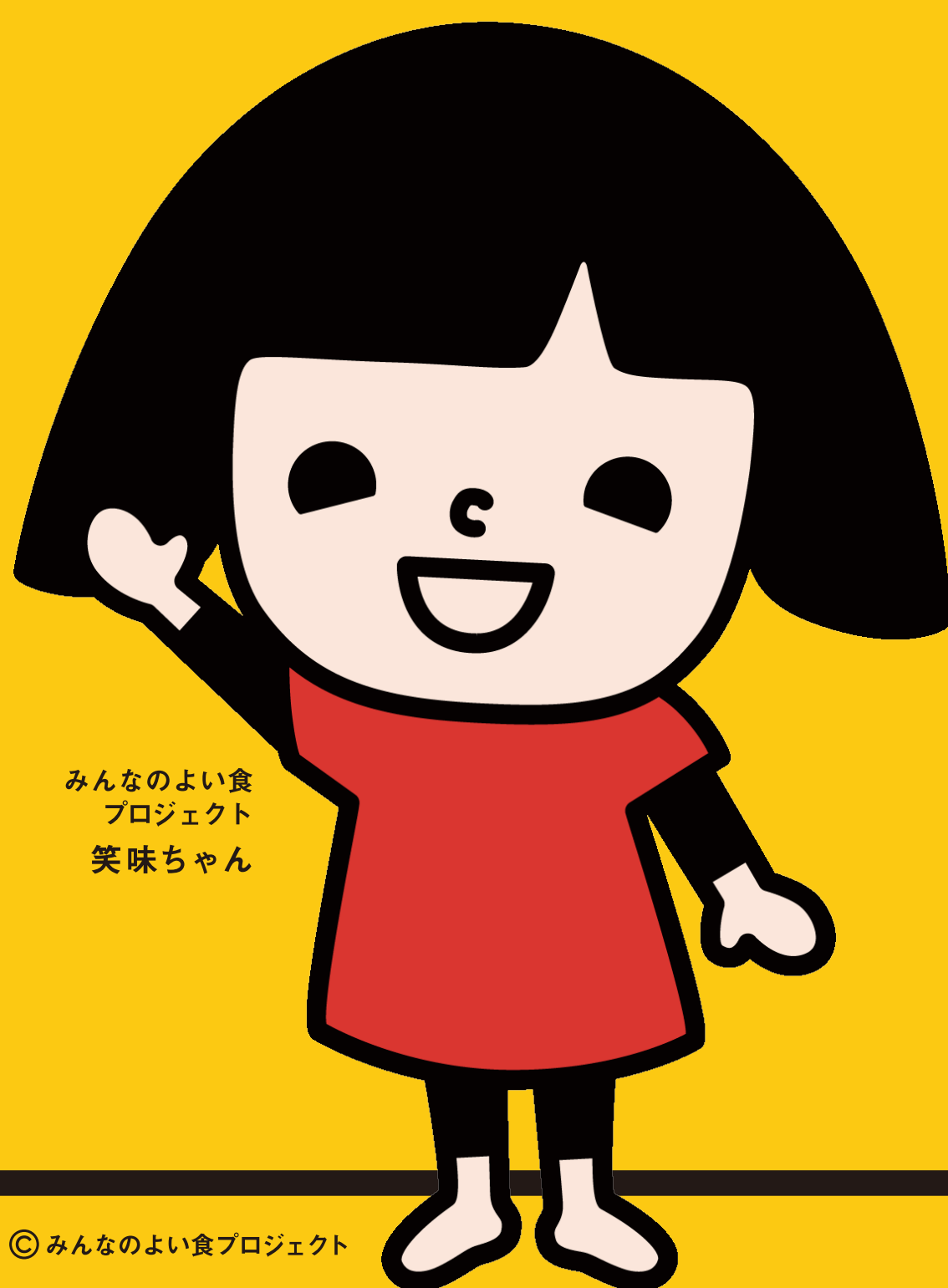
みんなのよい食 プロジェクト 笑味ちゃん