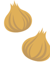
表1 たまねぎに登録がある主な除草剤

べと病・白色疫病は、気候が温暖で雨が続きと発生しやすくなる。排水路を整え、過湿にならないように注意する。発生初期には表2の薬剤で防除を行う。